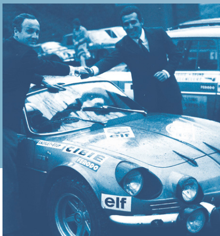
Jean-Claude Andruet, vainqueur sur Alpine en 68, 70 et 72, a retrouvé avec grand bonheur ses sensations durant la première édition.

L'esprit de notre aventure est un saut dans le temps pour revivre le tracé et l'histoire de cette épreuve mythique . Le tout dans une ambiance des plus conviviale sans pression. Avec près de 1300 kilomètres sur 3 jours et un circuit par jour ! What Else?