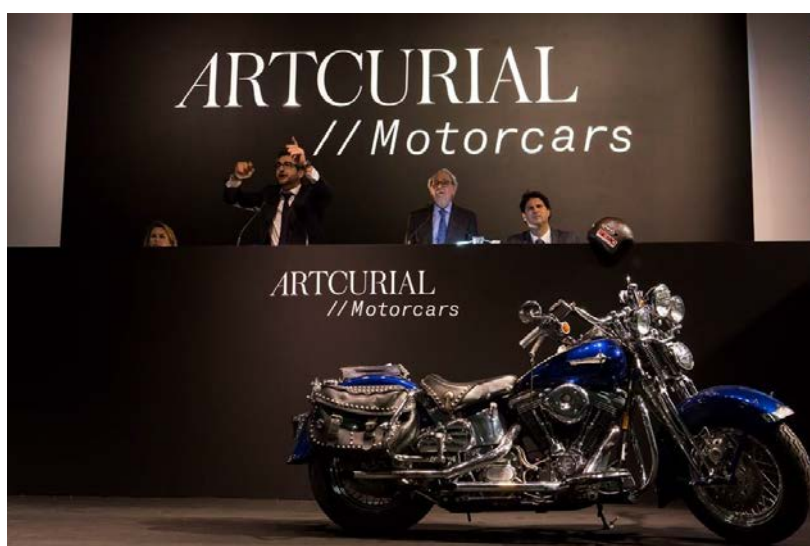
Lot 126 : 1989 Harley Davidson softail springer 1340 CC, vendu 280 000 €. Offert par Johnny Hallyday au profit de l'association La Bonne Etoile RECORD DU MONDE POUR CE MODELE VENDU AUX ENCHERES

La collection « Raging Bull » 5 lots d'exceptionnelles Lamborghini, dont une Miura SV (lot 75) rarissime vendue neuve en France, a de son côté séduit les acheteurs pour 2 960 400 € / 3 138 024 $.