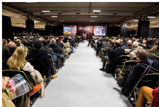
La vente Rétromobile 2017 by Artcurial Motorcars

Autre étoile des podiums, la Renault 5 Turbo (lot 95), appartenant à Jean Ragnotti, toujours, a fait grande impression et a été un des grands moments forts de la soirée. Présentée par le « gentleman des rallyes » et acclamée par la foule, elle a été adjugée 321 800 € / 341 108 $ frais inclus. Son acquéreur en salle a été félicité personnellement par Jean Ragnotti qui en a profité pour lui remettre par la même occasion sa combinaison de course de l'époque.