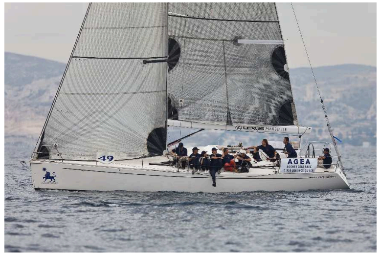
AGEA du Var édition 2010 3 eme au classement IRC1