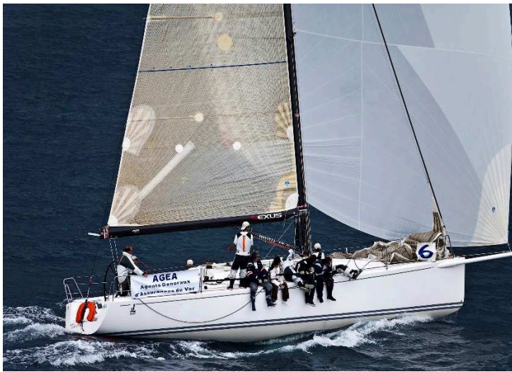
AGEA du Var édition 2009 1 er au classement IRC2