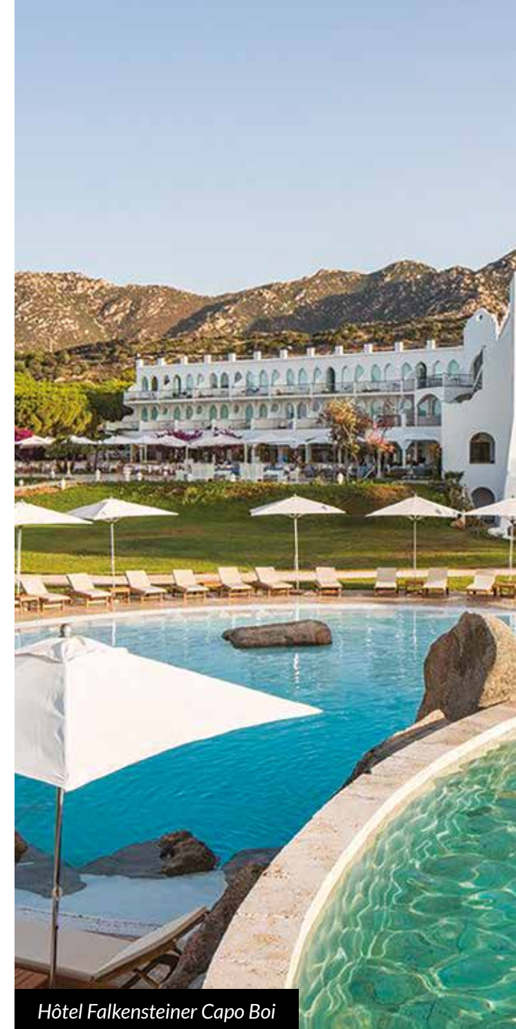
Hôtel Falkensteiner Capo Boi

L'hôtel Falkensteiner Capo Boi et sa plage privée est bien sûr l'endroit idéal pour aller nager au milieu des poissons dans cette eau bleu turquoise qui rappelle les Caraïbes.