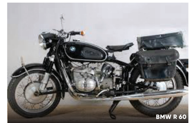
BMW R 60