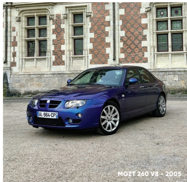
MGZT 260 V8 - 2005

Rare et puissante, avec son moteur Ford Mustang 260 longitudinal 4601 cm 3 et ses 260 cv à 5000 tours, la MG ZT 260 V8 illustre les ultimes tentatives de survie de la marque. Présentée à l'automne 2003, elle est commercialisée en France quelques mois plus tard. La faillite du groupe au printemps 2005 scelle la fin de cette légendaire marque sur le sol britannique. Produite à seulement 717 exemplaires, elle totalisera moins d'une dizaine d'immatriculation neuves dans l'Hexagone.