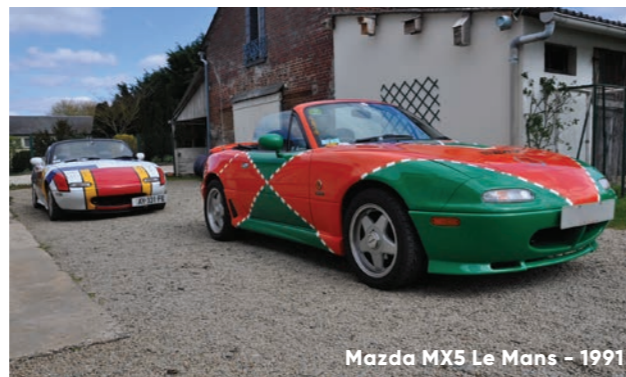
Mazda MX5 Le Mans – 1991

NOUVEAUTÉ VENTE AUX ENCHÈRES YOUNGTIMERS vendredi 8 novembre à 16h00