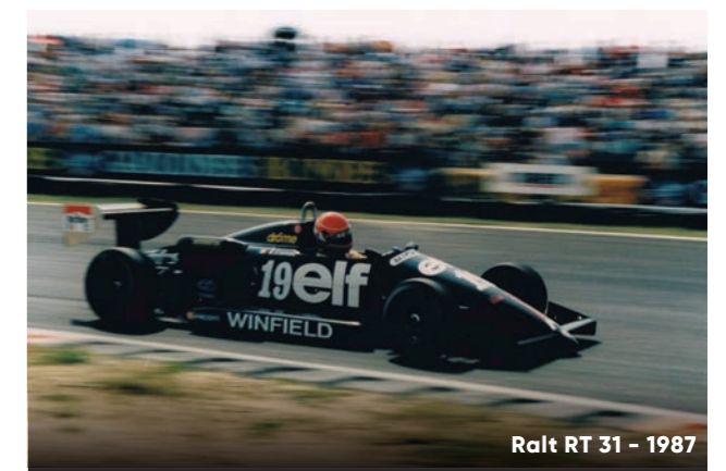
Ralt RT 31 - 1987

Enfin, pour rester fidèle à son histoire, ELF profitera d'Époqu'auto pour organiser un mini programme de détection. Un simulateur installé sur le stand permettra aux visiteurs de venir se tester sur un circuit virtuel. Le vainqueur gagnera une journée de pilotage sur Formule 4 à l'école Winfield sur le circuit Paul Ricard