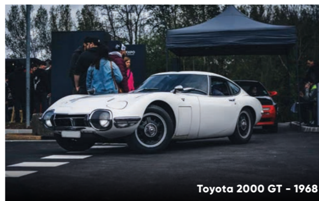
Toyota 2000 GT – 1968