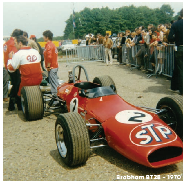
Brabham BT28 - 1970