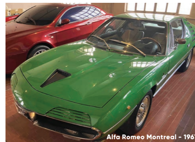
Alfa Romeo Montreal - 1967

Mais aussi le concept car Bertone Blitz affirme lui aussi