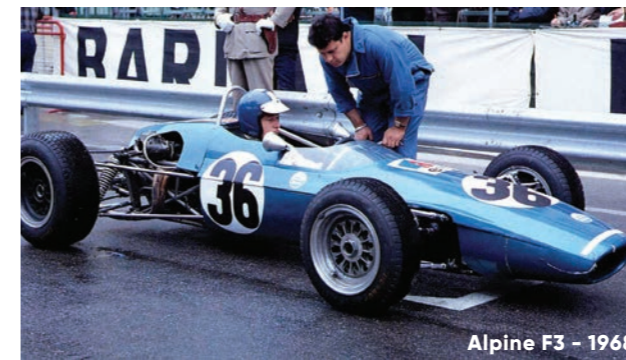
Alpine F3 - 1968

Pour revenir sur l'histoire de cette catégorie qui a constitué la première marche de carrières nombreuses exceptionnelles, il a retenu 12 voitures qui ont fait les belles heures de la F3. Des monoplaces légères, sans appuis aérodynamiques, qui demandaient une très grande finesse de pilotage pour être performantes.