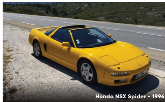
Honda NSX Spider – 1996