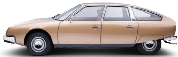
CX 2000 Super 1974 PRS2

Formidable routière, la Citroën CX a elle aussi été commercialisée à près de 1,2 million d'exemplaires. Produite entre 1974 et 1991, elle est le fruit de très longues études, lancées dès la fin des années 60 pour préparer le remplacement de la DS.