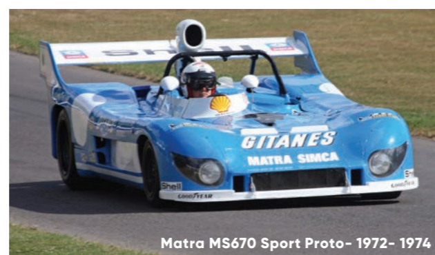
Matra MS670 Sport Proto- 1972- 1974