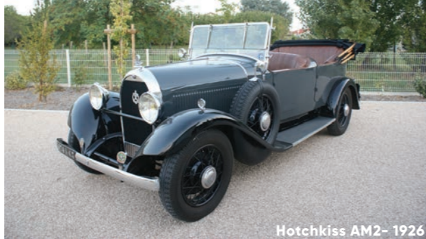
Hotchkiss AM2- 1926

Le plateau s'équilibre entre les modèles qui ont été carrossés directement par Hotchkiss et ceux qui ont été