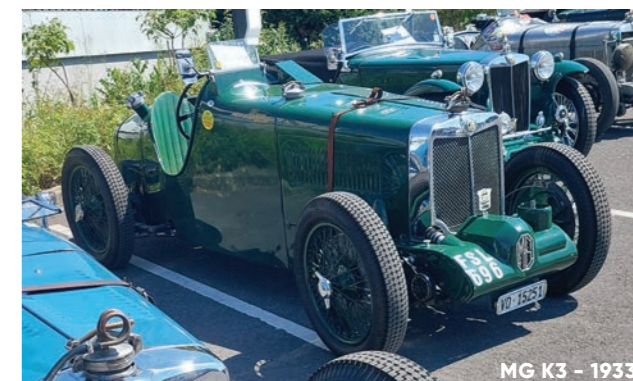
MG K3 - 1933

Ainsi, la MG K3 dont 33 exemplaires ont été produits en 1933 et 1934. Dotée d'un moteur 6 cylindres en ligne de