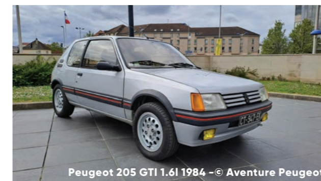
Peugeot 205 GTI 1.6i 1984

Sur le stand de L'Aventure Peugeot Citroën DS, cette nouvelle édition d'Époqu'Auto fournira l'occasion aux clubs Peugeot et Citroën de fêter les anniversaires de quatre modèles qui ont marqué l'histoire de ces deux marques. Ainsi la Peugeot 205 GTI et le Citroën C15 souffleront 40 bougies , tandis que la CX célébrera une saga d'un demi-siècle désormais . Enfin, la mythique Traction Avant a 90 ans cette année et L'Aventure Peugeot Citroën DS ne pouvait passer sous silence ce morceau d'histoire.