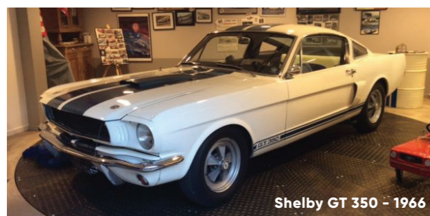
Shelby GT 350 - 1966

La Mustang coupé 1965 (la 180) fera également partie de l'exposition Mustang. En 2025, elle fera le parcours de concentration du 34ème rallye Monte-Carlo qu'elle avait fait à l'époque en 1965, c'est à dire 4 800 km en 6 jours pour arriver à Monaco.