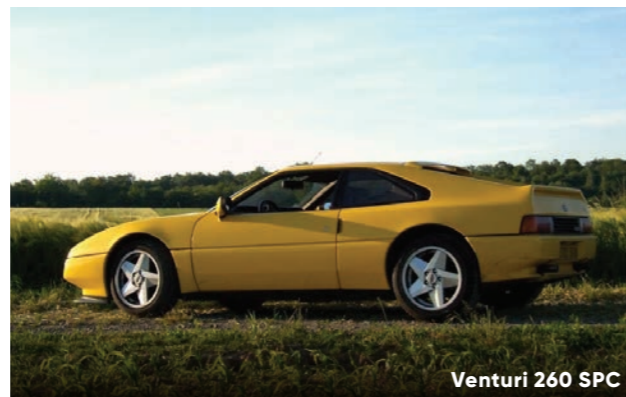
Venturi 260 SPC

L'Historique Tourisme Champion Car (HTCC) , organisateur de rallyes pour des voitures de tourisme homologuées en Groupe 1 jusqu'en 1981 et en Groupe N jusqu'en 1991. Lancia Net , qui réunit les passionnés de Lancia sorties d'usine entre 1980 et aujourd'hui.