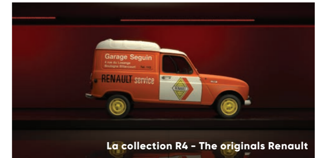
La collection R4 - The originals Renault

encore la vasque qui a survolé la capitale pendant les Jeux Olympiques de Paris 2024.