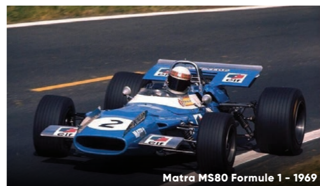
Matra MS80 Formule 1 - 1969