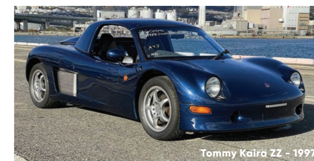
Tommy Kaira ZZ - 1997