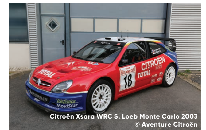
Citröen Xsara WRC S. Loeb Monte Carlo 2003