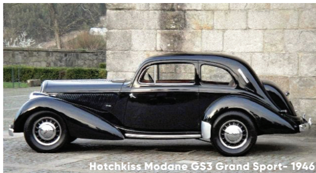
Hotchkiss Modane GS3 Grand Sport- 1946

mis en valeur par d'autres carrossiers. Ainsi, la merveilleuse Hotchkiss 686 GS3 Mégève , produite à une dizaine d'exemplaires seulement, proposera un remarquable exemple du travail réalisé par Hotchkiss comme carrossier. Il en va de même pour la Hotchkiss Monceau carrosserie Chapron de 1954 . Il ne reste plus que deux exemplaires de cette voiture, qui fut le dernier modèle civil présenté par le constructeur.