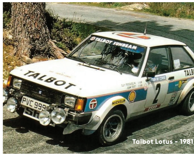
Talbot Lotus - 1981

Outre la présence exceptionnelle de Guy Fréquelin, les pilotes Jean-Claude Andruet, Henri Pescarolo, Pierre Lartigue et Gérard Larrousse seront présents durant les trois jours du salon. Ils rencontreront les visiteurs à l'occasion de plusieurs séances de dédicaces quotidiennes.