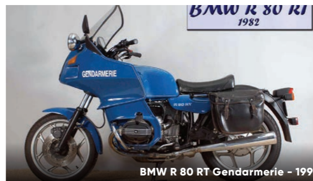
BMW R 80 RT Gendarmerie – 1996

À l'image des Youngtimers, les motos attirent sur le salon un public chaque année plus nombreux. Des visiteurs, mais aussi des exposants, puisque de très nombreux clubs viendront animer cet espace. Des habitués pour la plupart, mais aussi quelques nouveaux venus que les organisateurs du salon sont particulièrement heureux d'accueillir.