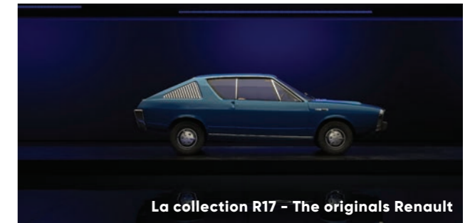
La collection R17 - The originals Renault