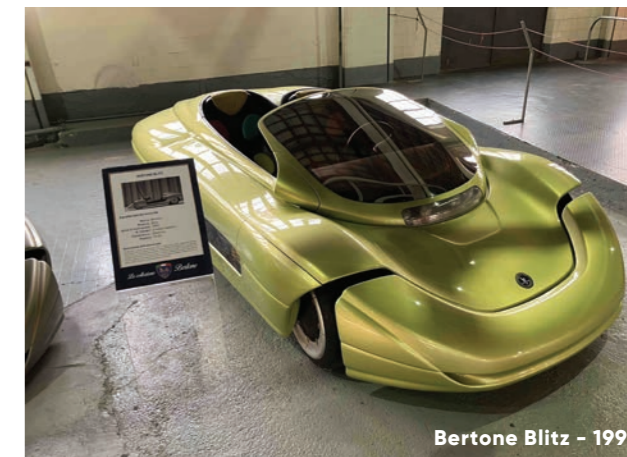
Bertone Blitz - 1992

le génie anticipateur du carrossier turinois. Avec sa ligne d'une fluidité exceptionnelle et son poids de 650 Kg, ce roadster électrique futuriste, présenté en 1992, affichait des performances impressionnantes: de 0 à 100 Km/H en 6 secondes; recharge complète en 4 à 6 heures pour une autonomie de 120 Km.