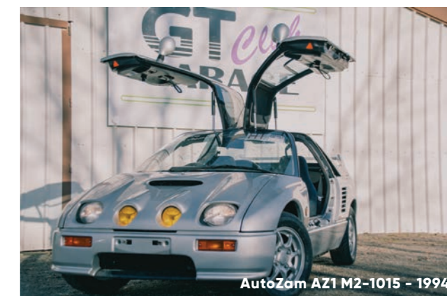
AutoZam AZ1 M2-1015 - 1994

Pour présenter ce véhicule emblématique, les organisateurs ont pu s'appuyer sur le Musée des 24 Heures du Mans, où 5 000 m 2 d'exposition sont dédiés aux véhicules de compétition, dont la grande majorité sont issus directement de la piste voisine.