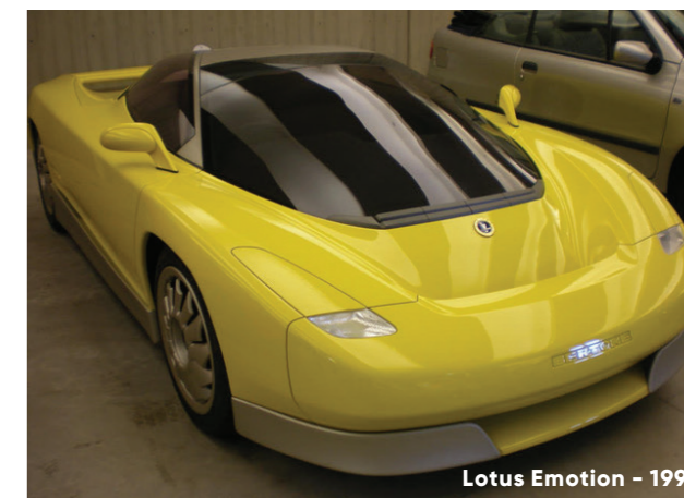
Lotus Emotion - 1991

Et enfin le concept car Autobianchi Runabout (1969) conçu, réalisé et dessiné par Marcello Gandini connaîtra une histoire différente. Réalisé à partir de la plateforme de l'Autobianchi 112, avec un moteur central et une boîte empruntée à la Lamborghini Miura, il servira de base au Spider Fiat X1/9.