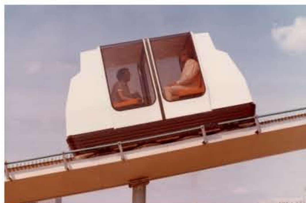
TRIDIM en démonstration sur pente dans les années 70

En février prochain, la petite équipe de l'Association des amis de Jean Bertin, qui assure depuis de nombreuses années la préservation de ce patrimoine qui reste très contemporain, présentera le prototype TRIDIM en démonstration dynamique sur coussins d'air qui circulera sur une voie de 20 m au sein même du salon Retromobile. Récupéré à l'état d'épave en 1998, les bénévoles de l'association ont entièrement restauré ce prototype. Aujourd'hui, son look et ses couleurs font du TRIDIM une icône des années 70.