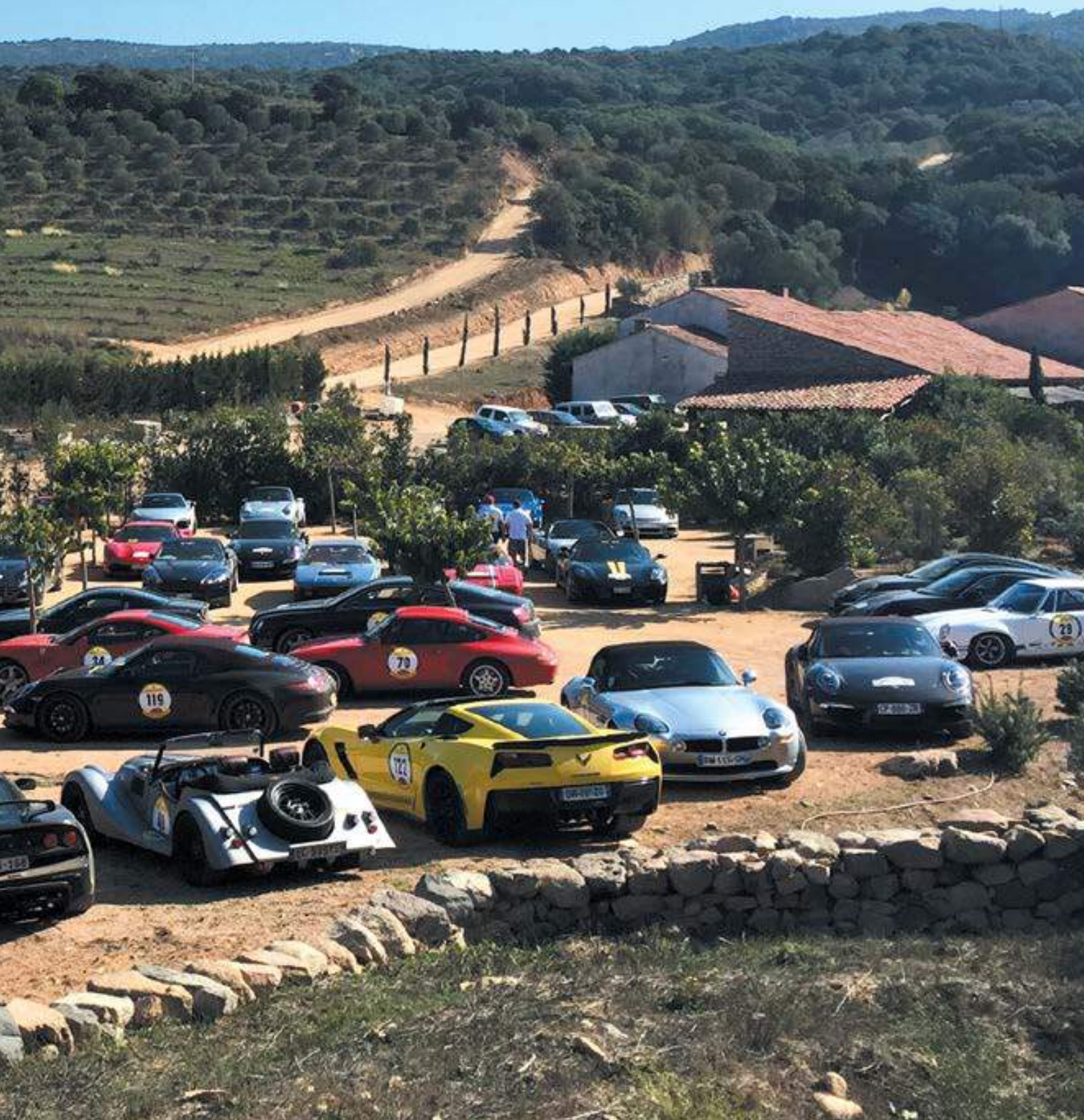
Domaine de Murtoli : arrêt déjeuner incontournable du rallye