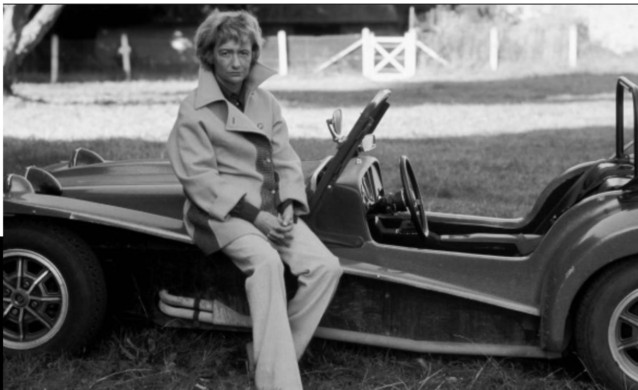
La voiture préférée de Françoise SAGAN

fulgurance, vélocité et agilité - firent bien vite de « la petite Lotus » ainsi qu'elle la nommait, son jouet favori, et elle portait à cette voiture, qui l'amusait tant, un attachement réel. Il n'y eut guère dans mon souvenir que la 250 California - qu'elle appelait d'ailleurs avec affection « la petite Ferrari » - qui lui inspirât un sentiment comparable. Vers la fin de l'après-midi, lorsque le temps le permettait, ma mère avait pour habitude de m'emmener faire un tour dans la campagne alentour avec la Lotus. Nous prenions à gauche à la sortie de la propriété, puis à deux cents mètres à droite, un virage épingle à cheveux, sur la petite route étroite qui descend vers Barneville-la-Bertran et continue de tortiller, une fois passé le village et sa mairie - où elle épousa mon père un après-midi de janvier 1962, sur trois ou quatre kilomètres à travers des petits vallons, des sous-bois et des pâturages. »