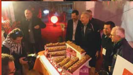
Autour du gâteau ... d'anniversaire : 20 e édition du Rallye Monte-Carlo Historique