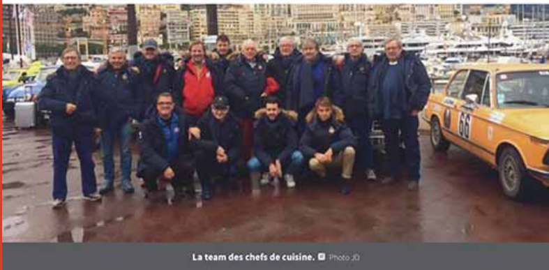
La team des chefs de cuisine.

Mis à jour le 28/01/2017 à 15:26 | Publié le 28/01/2017 à 15:26