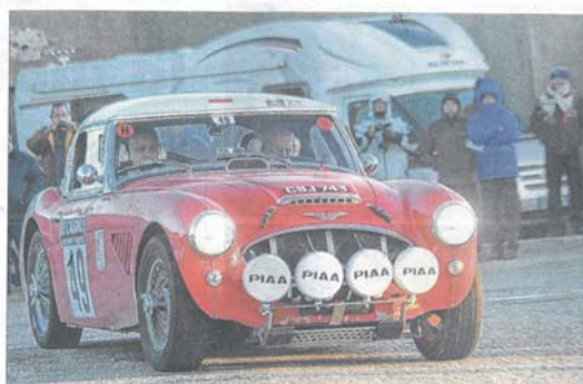
Malgré son demi-siècle, l'Austin Healey demeure une attraction sur les routes du Monte-Carlo.

de 36 km jusqu'à Plats via Gilhoc-sur-Ormeze. Il sera alors temps de rejoindre le parc fermé de Valence, non sans avoir effectué une halte quai Farconnet, à Tournon-sur-Rhône, sur les coups de 15 heures. Un seul regret, tout de même : l'absence de la boucle de Saint-Bonnet-le-Froid, un des « monuments » du Monte-Carlo, revenu l'an dernier au menu mais qui n'a pas été retenu pour ce 20 e anniversaire ! Enfin, si l'ensemble des routes resteront ouvertes à la circulation et que les équipages doivent impérativement respecter le code de la route, les automobilistes sont invités à la plus grande prudence, surtout s'ils empruntent à contresens la vallée du Doux et le secteur de Lamastre, Gilhoc-sur-Ormeze et Plats.