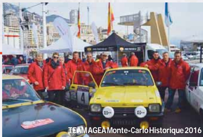
TEAM AGEA Monte-Carlo Historique 2016