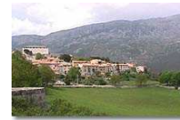
Ronde de Cipieres 31/08/2013