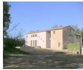
Ronde hivernale de Roquefort les Pins 16/02/2013