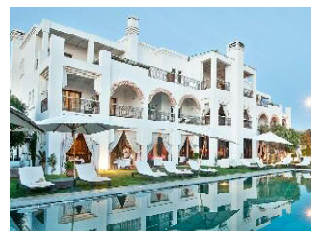
AGADIR LA VILLA BLANCHE*****