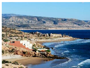
TAGHAZOUT HYATT PLACE****