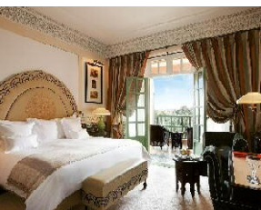
MARRAKECH LA MAMOUNIA*****