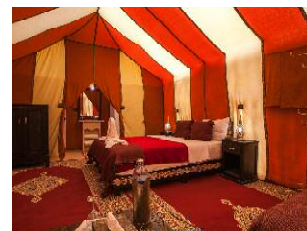
FOUM ZGUID BIVOUAC DE LUXE