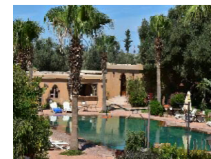
TAROUDANT DAR ZITOUNE****