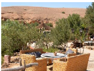
AGAFAY LA PAUSE****