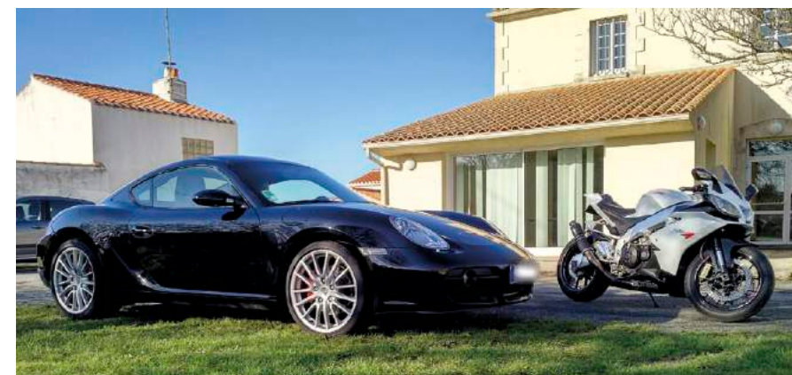
Benjamin est un mordu de voitures et de motos. Et rêve un jour d'une italienne, le rustre...