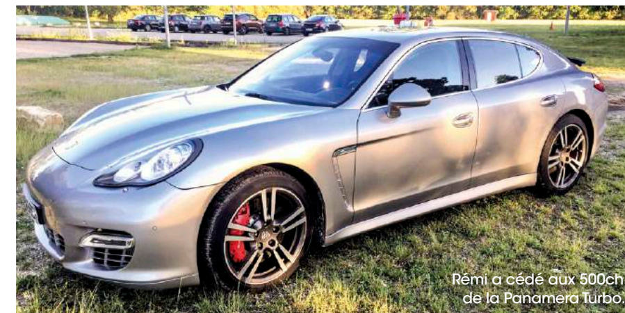
Rémi a cédé aux 500ch de la Panamera Turbo.