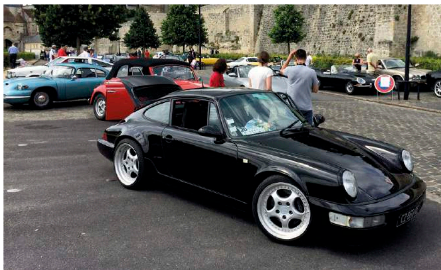
Thibault rêvait d'une 964 aussi proche que celle de Bad Boys.

l'histoire ancienne et aujourd'hui, on doit, et on peut prendre beaucoup de plaisir autrement. Sur des petites routes en Alsace, en Savoie, et même dans des contrées bien moins vallonnées. Et surtout, n'oublions pas que la passion automobile ne serait rien sans le partage qu'elle suppose, tant avec les autres amateurs qu'avec les néophytes qui viendront vous demander ce qu'est votre belle auto. Le but de ces voitures est de nous coller un grand sourire lorsque nous sommes derrière le volant, et d'en offrir un grand à tous ceux qui aiment cela. On ne peut plaire à tout le monde, et cela ne doit pas nous empêcher de penser avant tout au plaisir, et l'époque n'y changera rien.