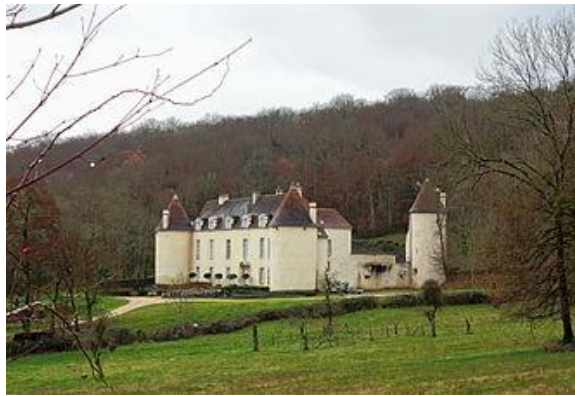
Colombarien ou Colombarienne. (Bien sûr si vous y retourner !)

Les cinq kilomètres le long du canal de Bourgogne dans la vallée de l'Ouche offrent un repos mérité aux directions de nos autos fortement demandées par l'itinéraire précédent, tant le macadam sans trous le long du canal est d'une grande douceur. A croire que le Tour de France cycliste est passé par là ! Un Z dans Pont d'Ouche pour trouver la route de Colombier,