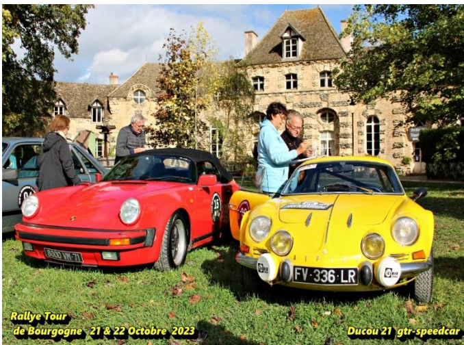
Rallye Tour de Bourgogne 21 & 22 Octobre 2023