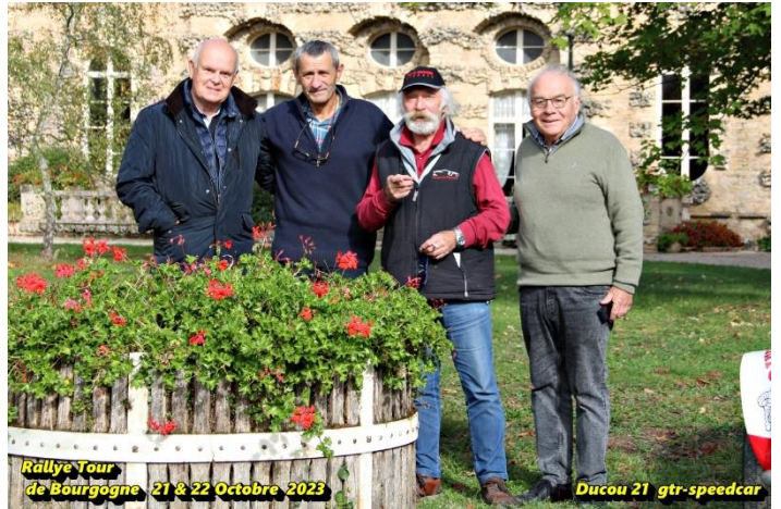
Rallye Tour de Bourgogne 21 & 22 Octobre 2023