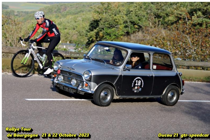
Rallye Tour de Bourgogne 21 & 22 Octobre 2023