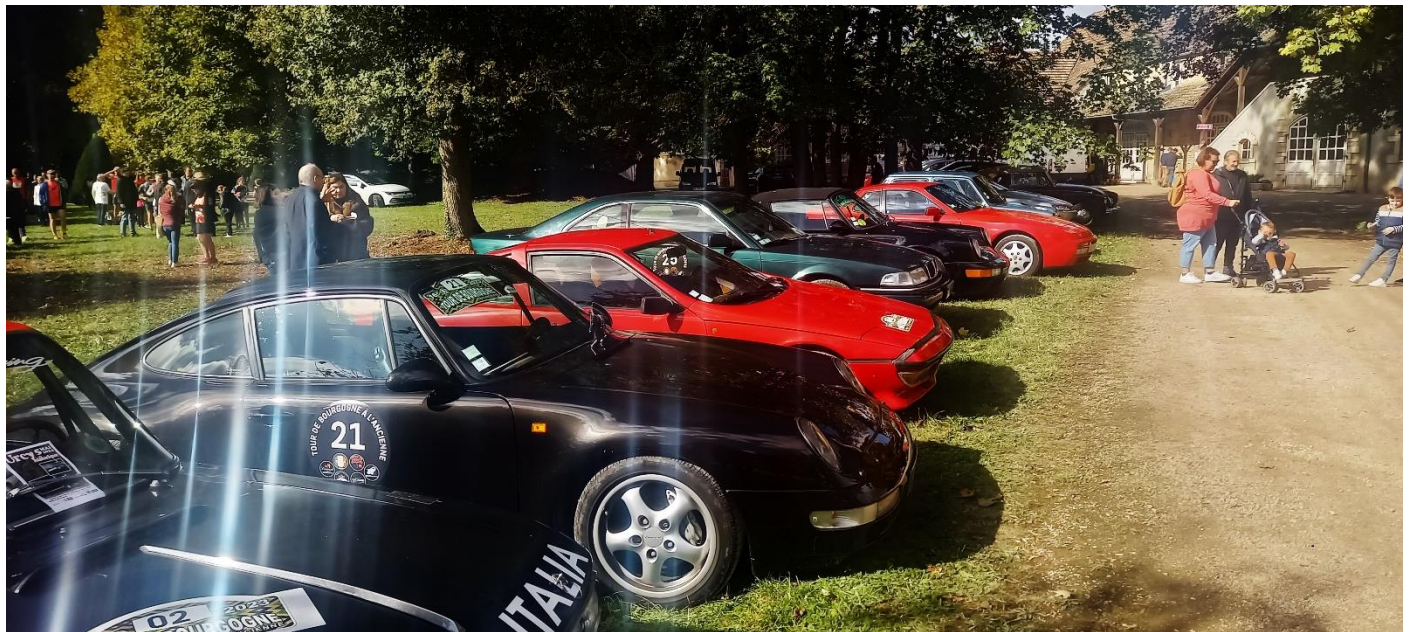
Ducou 21 gtr-speedcar

C'est avec ces autos qu'il participa à de nombreuses courses de côte.