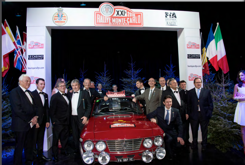
Le team des Chefs, la piste aux Etoiles...