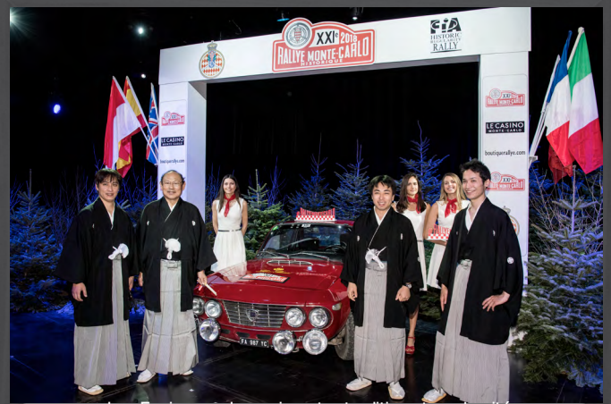
Les Equipages Japonais, entre tradition et modernité, mais toujours avec le sourire.