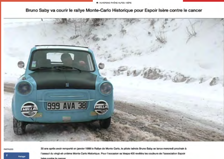
Bruno Saby va courir le rallye Monte-Carlo Historique pour Espoir Isère contre le cancer

30 ans après avoir remporté en janvier 1988 le Rallye de Monte-Carlo, le pilote isérois Bruno Saby se lance mercredi prochain à l'assaut du vingt-et-unième Monte-Carlo Historique. Pour l'occasion sa Vespa 400 revêtira les couleurs de l'association Espoir Isère contre le cancer.