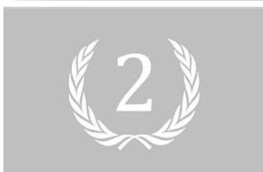
#256 - 2 e du 22 e Rallye Monte-Carlo Historique DE ANGELIS Alession (ita) / SISTI Sergio (ita)