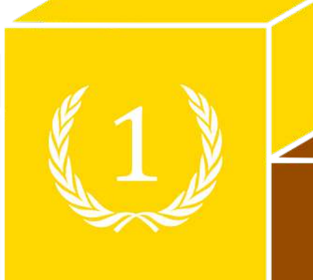
#261 - Vainqueur du 22 e Rallye Monte-Carlo Historique BADOSA Michel (fra) / REIDL Mogens (fra)