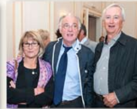
Le dîner de clôture a lieu au Grand hôtel du Palais de BIARRITZ, un des 5 palaces Français.