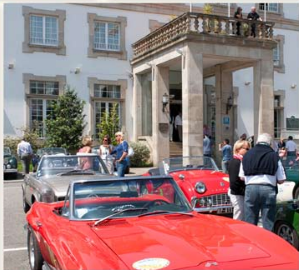
La 2ème étape suit le bord de mer. Le déjeuner a lieu au Parador de FERROL, port militaire lieu de naissance du Général FRANCO.