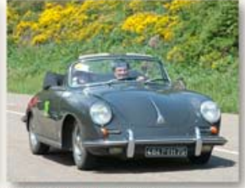
La courte étape de l'après midi nous conduit à CERVERA par le PUERTO DE PIEDRAS CUENGAS (1355m). Le Parador, moins somptueux que les précédents est situé en montagne.