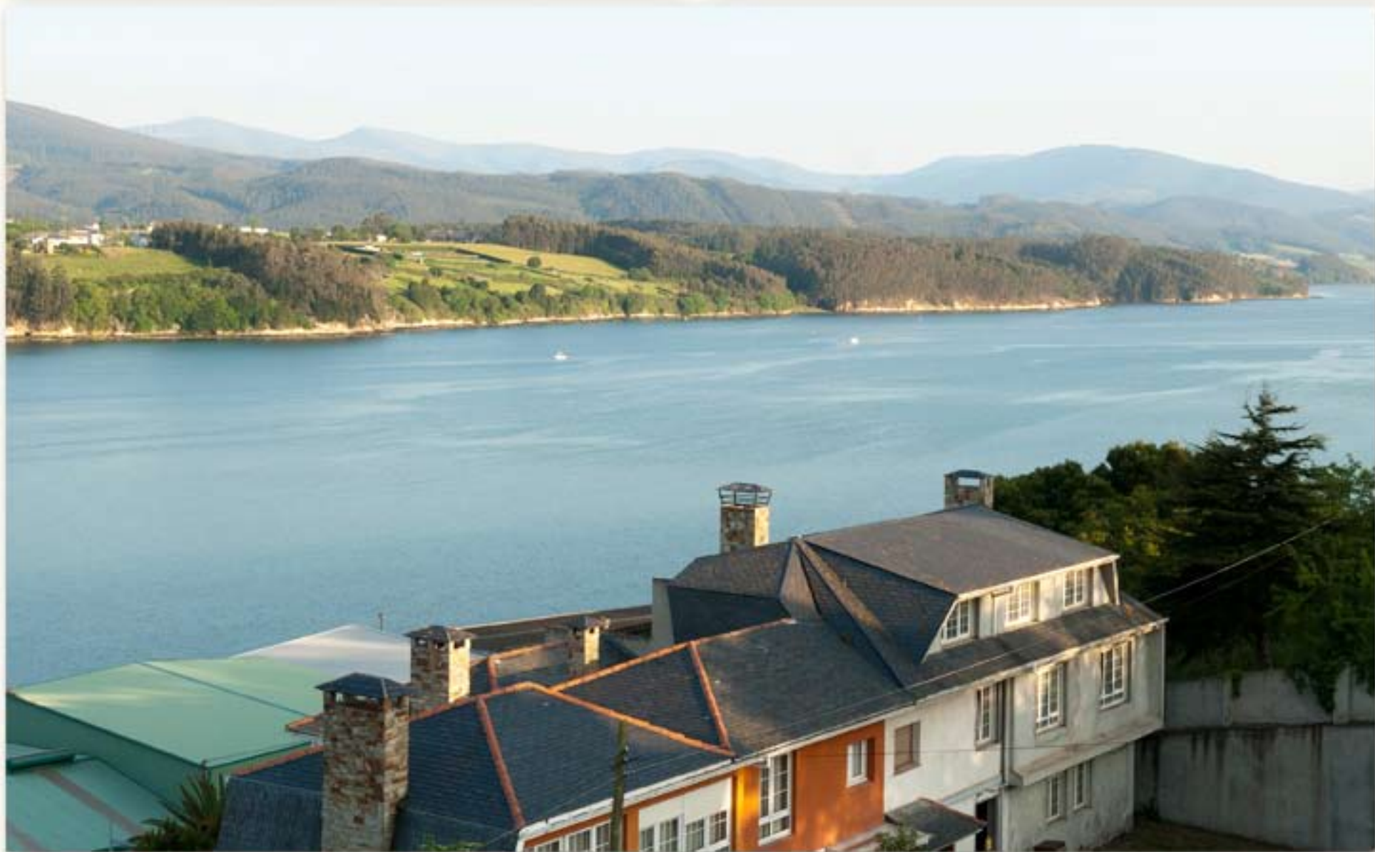
La ria de Ribadeo est le lien naturel qui unit le territoire Galicien et les terres Asturiennes, voisines sur l'autre rive. La principale localité de cette ria profonde, dessinée par la rivière Eo est Ribadeo.