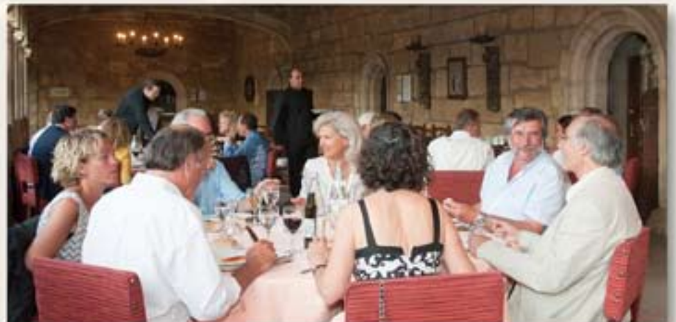
L'HOSTAL SAN MARCOS bijou d'architecture. Nous avons le privilège de dîner sur le promenoir du cloître.