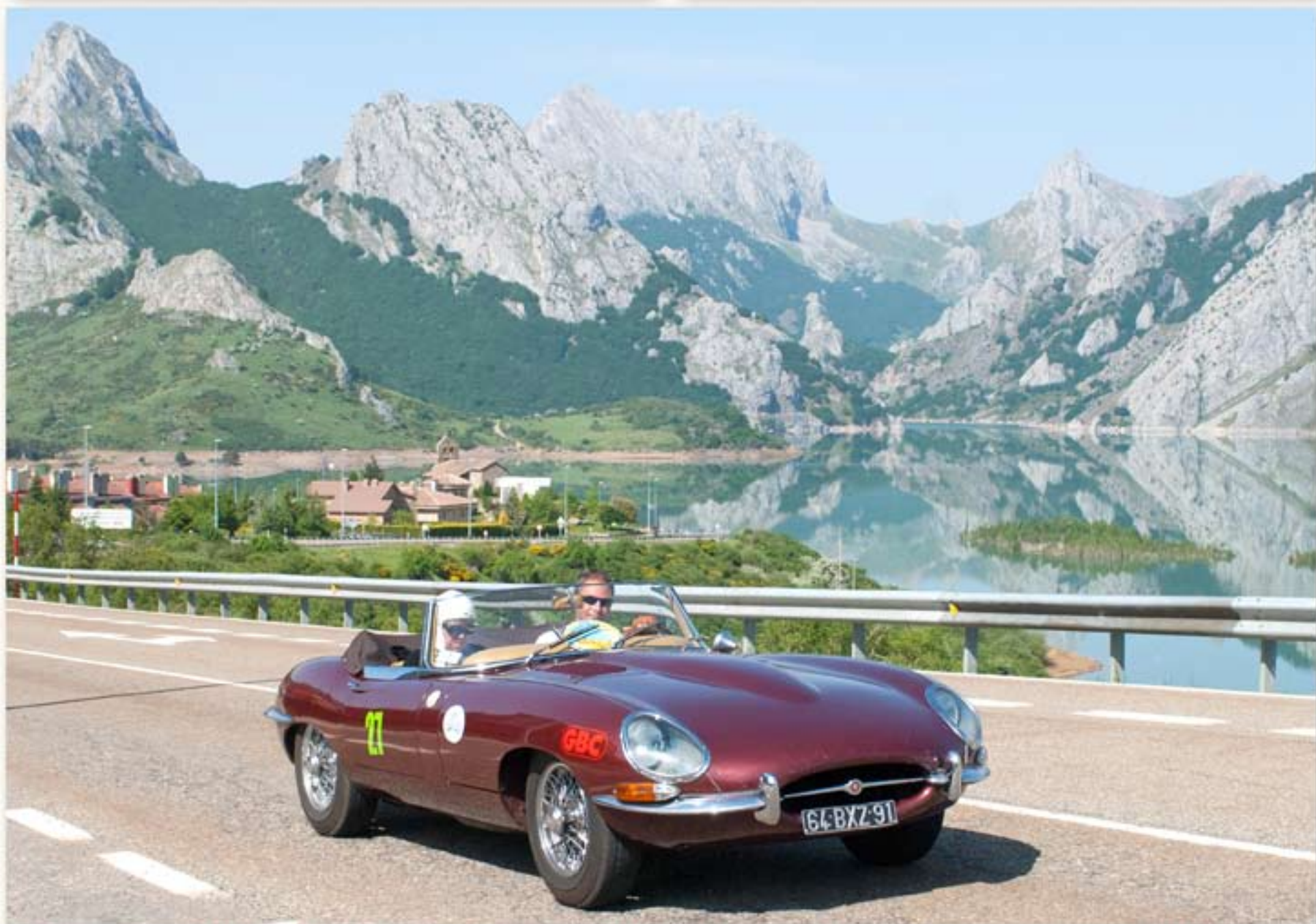
Départ vers la montagne Les pics d'Europe ou Los Picos de Europa (souvent appelés los Picos), Massif le plus élevé de la cordillère Cantabrique (Torre de Cerredo, 2 648 m)