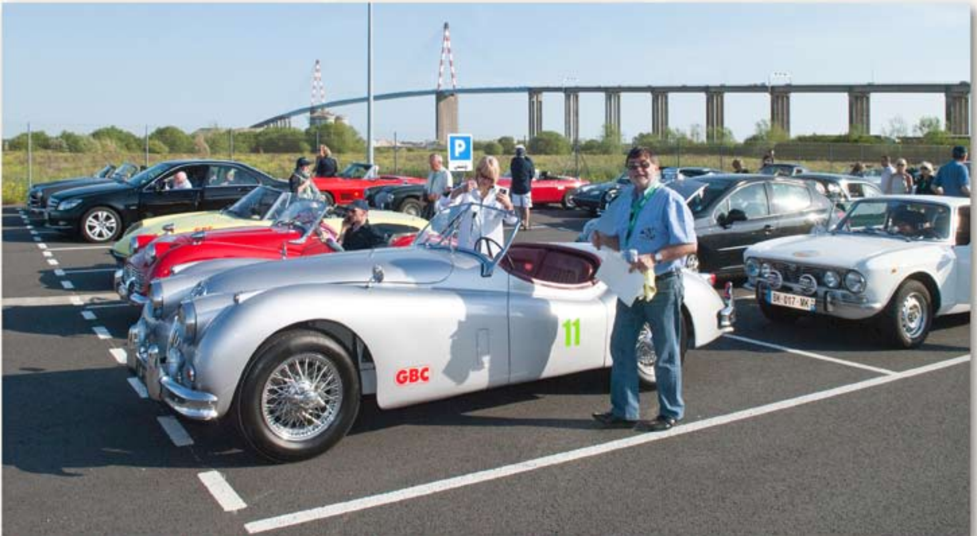
Enregistrement à Saint-Nazaire sur la ligne de ferry LD Lines crée pour le transit des camions espagnols afin de délester les autoroutes françaises.