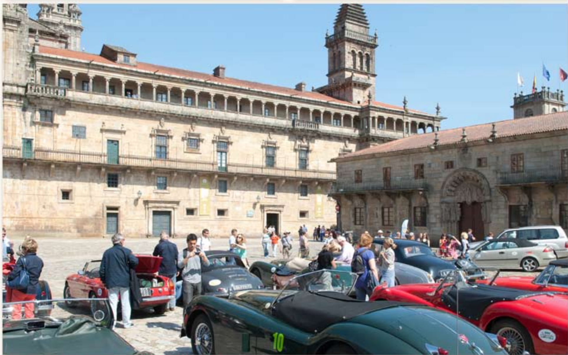
SAINT JACQUES DE COMPOSTELLE. Jean-Pierre a réussi après de longues tractations à obtenir le droit pour les véhicules de stationner sur la place de la Cathédrale ! moment étonnant pour les équipages et les pèlerins (assis par terre ... épuisés... car eux ne sont pas arrivés en voiture anciennes !!)