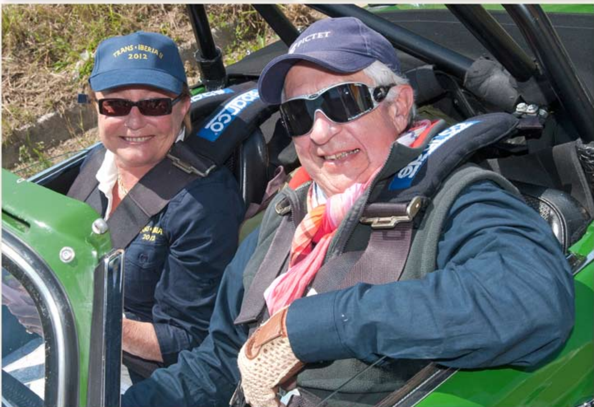
Huit équipages nous ont rejoints pour le déjeuner dans l'ancienne cidrerie d'AGUA DEL NACERA où nous fûmes excellentement accueillis avant le départ de la 1ère étape qui nous conduit en bord de mer à RIBAIDO dans la province des Asturies.