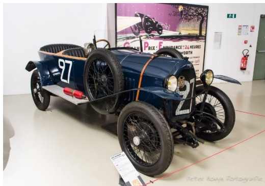
Vinot Deguingand © FFVE