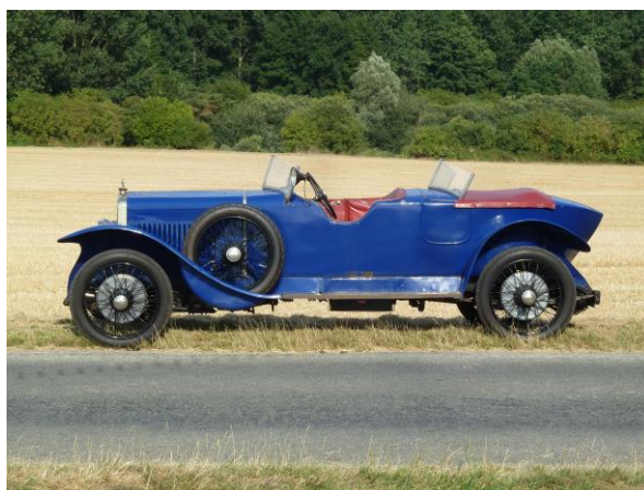
Georges Irat