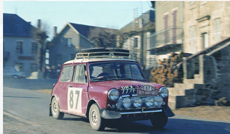
Mini Cooper S Monte Carlo