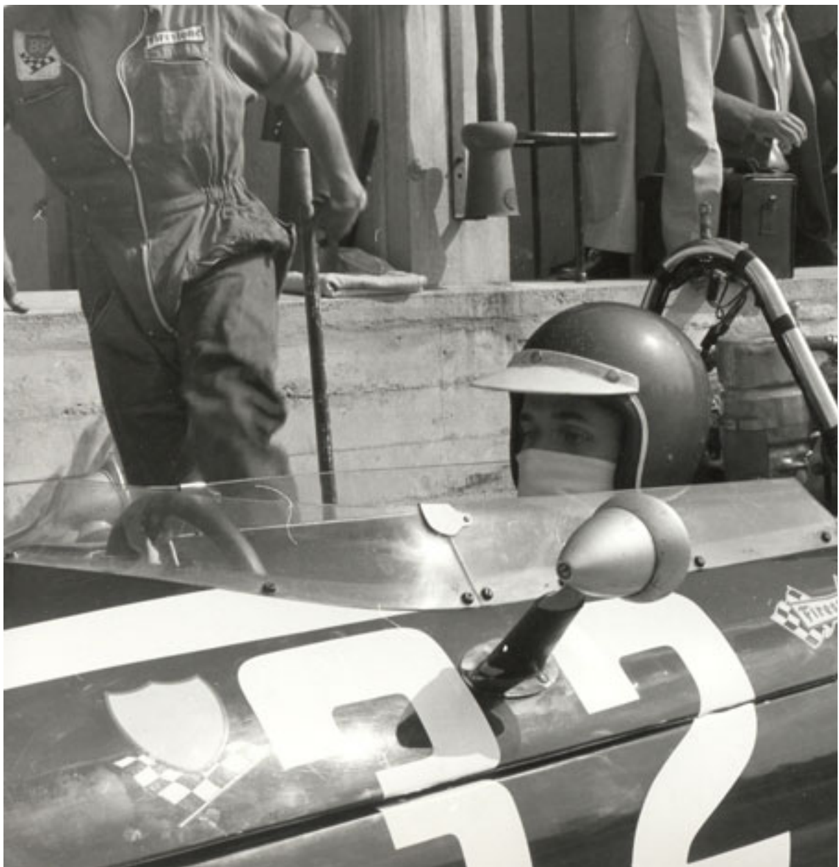
Premiers pas officiels en F1 lors du Grand Prix d'Italie 1967 sur Cooper-Maserati, avec la 6ème place à la clé.

Equipier de Jackie Stewart en Formule 2, Ickx apprend vite et a l'occasion de se faire remarquer lors du Grand Prix d'Allemagne 1967 disputé sur le grand Nürburgring. Au volant d'une modeste Matra de Formule 2, il battu la quasi-totalité des Formule 1 aux essais du Grand Prix d'Allemagne au Nürburgring.