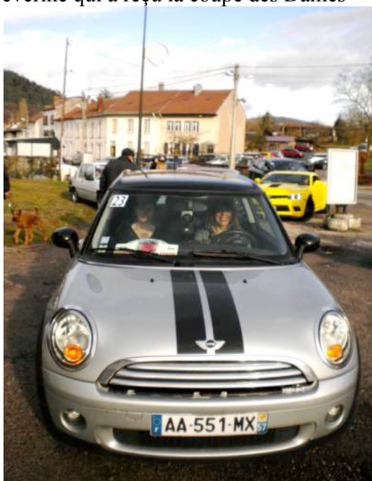
Un équipage féminin

Cette année, il y avait 4 équipages féminins qui se sont bien classés en particulier l'équipage DENAIN Gabrielle - CAJELOT Séverine qui a reçu la coupe des Dames