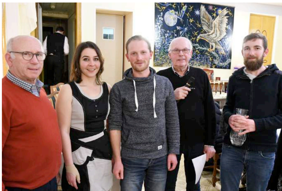
L'équipage gagnant en Navigation

La soirée s'est achevée dans la bonne humeur autour d'un repas simple mais de bonne qualité.