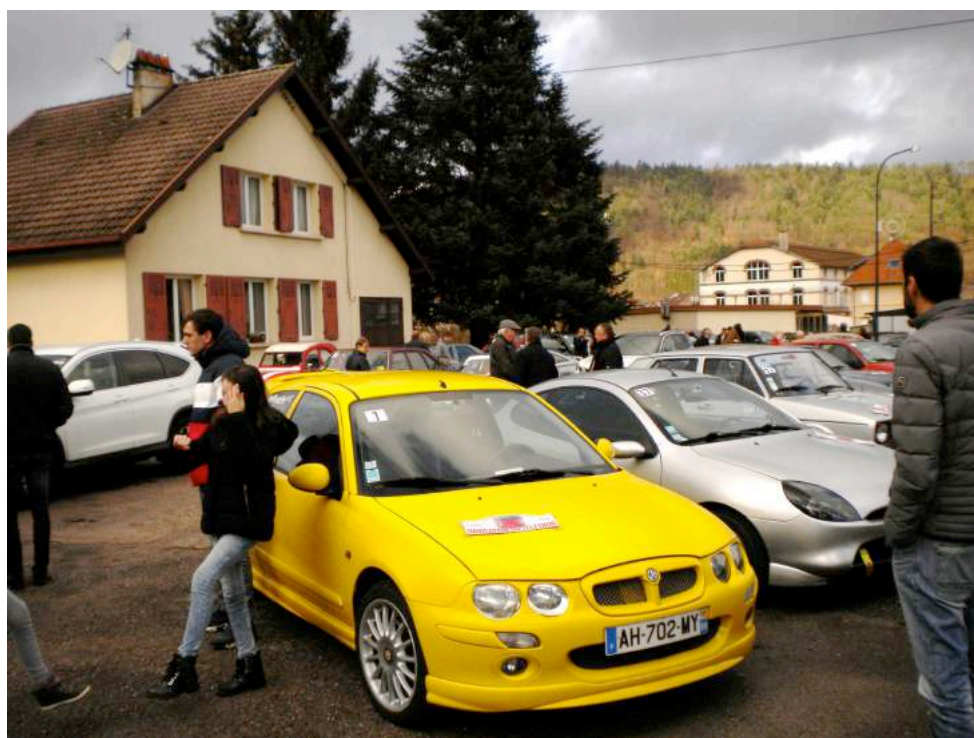
En attendant le départ

Le rendez-vous était donné à partir de 12H 30 au 16 rue Jacques Mellez à Raon l'Etape. Pain, saucisson, café et brioche permettaient aux concurrents d'attendre leur tour aux formalités et surtout de faire connaissance ou de se retrouver et bien sur, parler voiture.