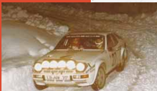
Rallye Monte-Carlo 1980 Jurgen Barth / Roland Kussmaul - Porsche 924 N°27

Une chose est certaine, la Porsche N°27 ( comme en 1980 ) n'aura pas besoin d'assistance mécanique.