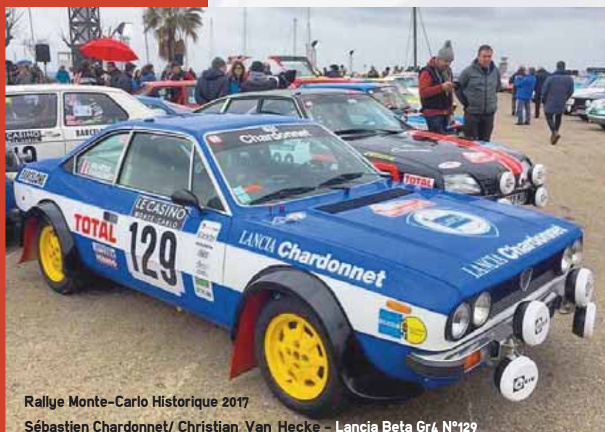
Rallye Monte-Carlo Historique 2017