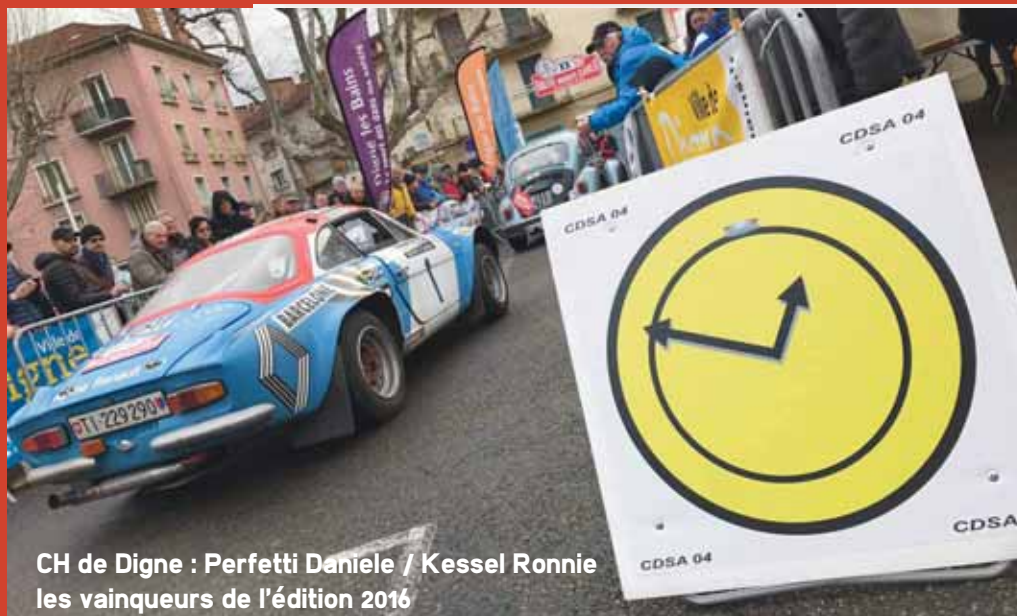
CH de Digne : Perfetti Daniele / Kessel Ronnie les vainqueurs de l'édition 2016