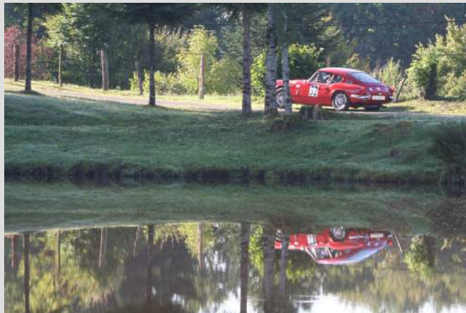
Un lieu merveilleux

Ensuite ils reprennent la route pour le Markstein et se dirigent vers Soultzmat.