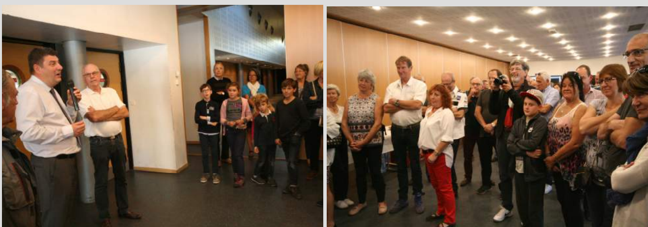
Pendant le discours du Maire de Raon l'Etape

Cette année, Monsieur le Maire en personne est venu saluer tous les équipages insistant sur l'intérêt de telles manifestations pour faire connaître Raon l'Etape et son environnement.