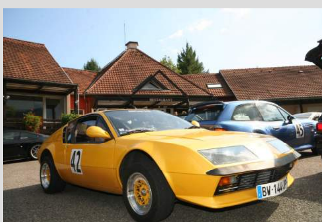
Au Parking du restaurant Vallée Noble