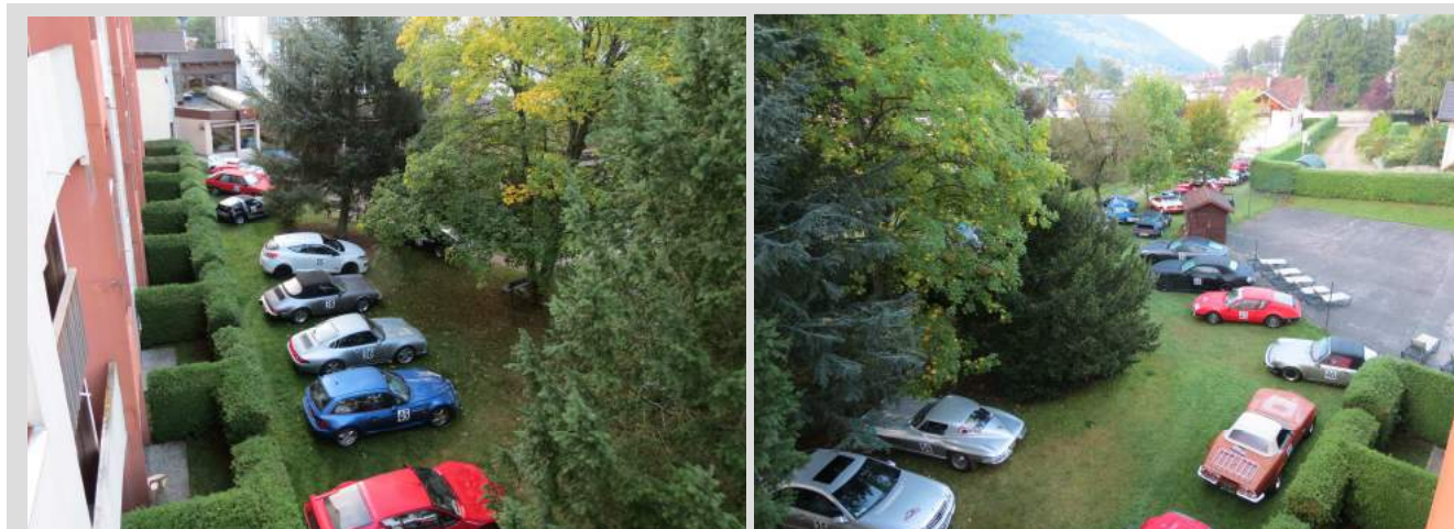
Les Voitures sont garées dans le parc de l'hôtel

Tous arrivèrent émerveillés par les paysages traversés au soleil couchant.