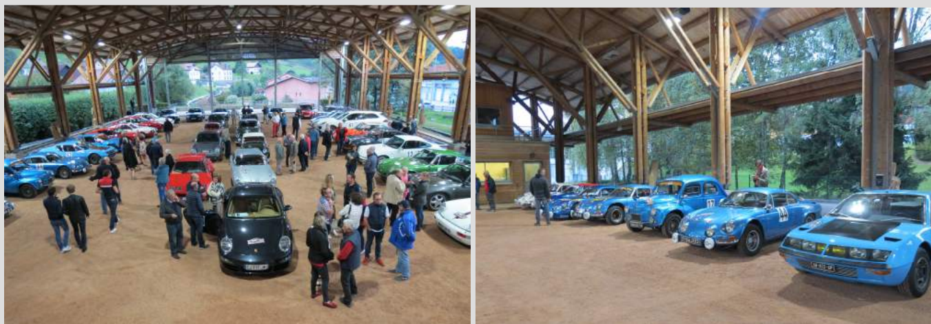
Les voitures sont exposées à la Halle Patinoire

La Pause terminée, tout le monde reprend la route pour le retour à La Bresse. Ils sont attendus par Monsieur la Maire à la Halle Patinoire où leurs belles voitures sont exposées le temps des discours et de l'apéritif.