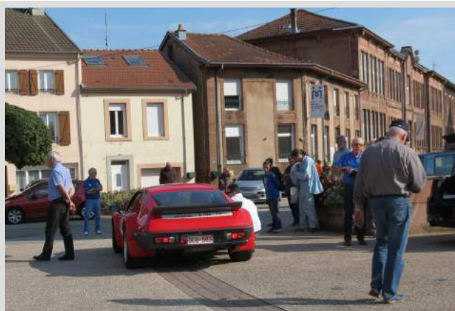
Voiture N° 2