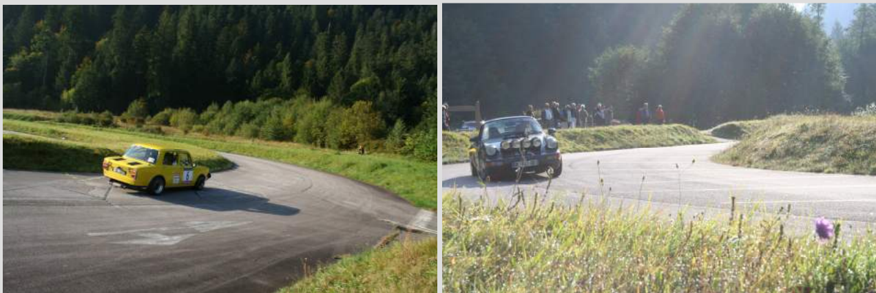
Sur l'ex circuit Andros

Les conditions météo étaient favorables à de belles prestations, applaudies par les autres concurrents et les locaux venus les voir.