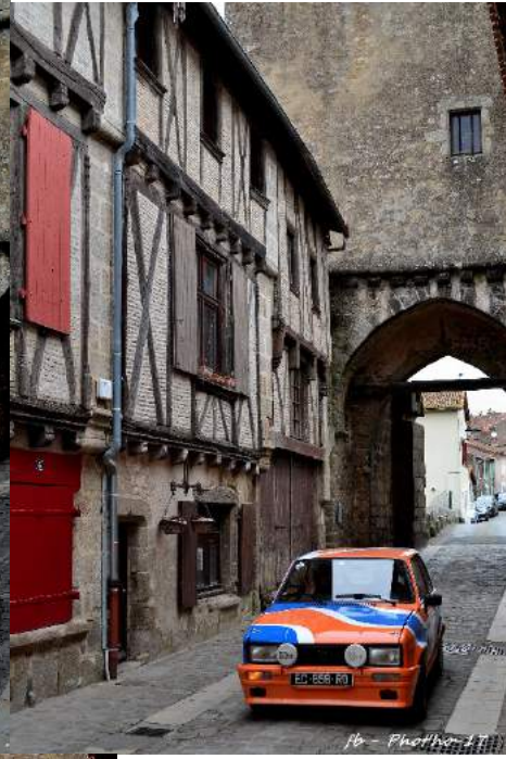
fb - Photo 17