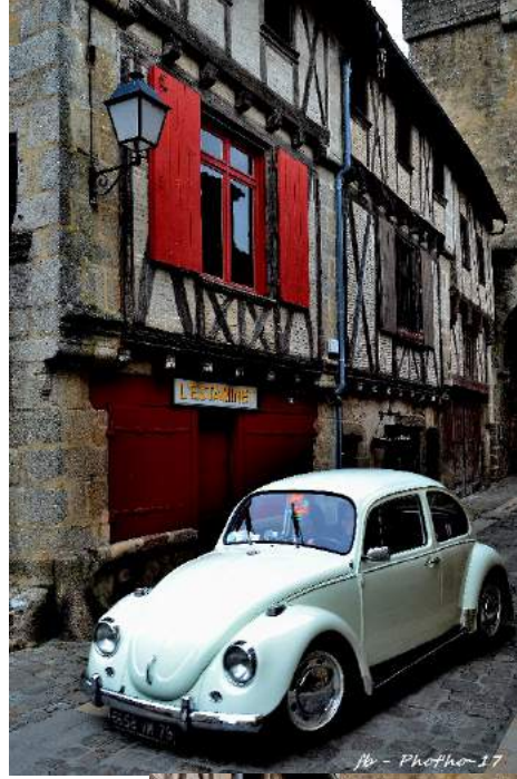
fb - Photo 17