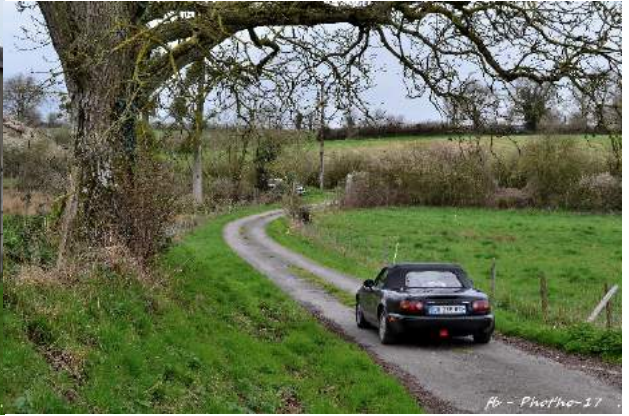
fr - Photo-17