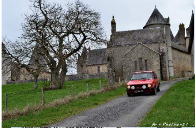
fr - Photo-17