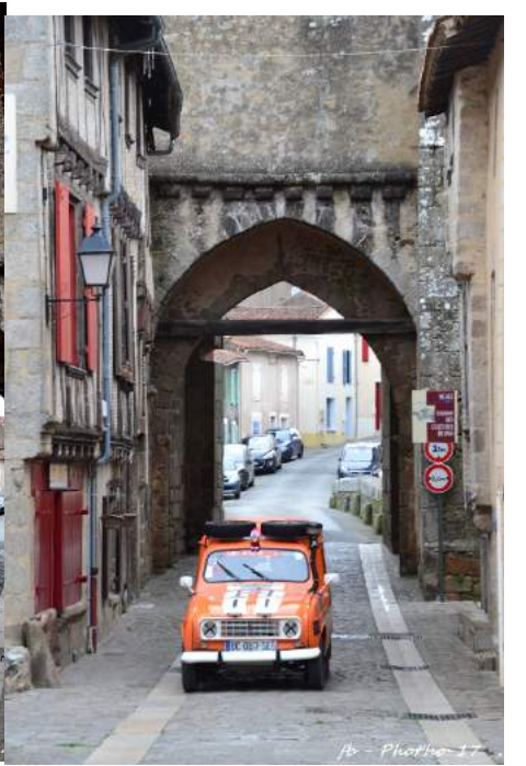
fb - Photo 17