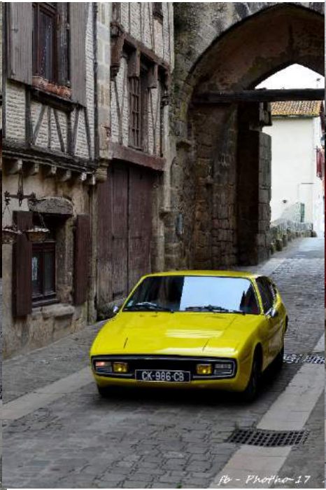
fb - Photo 17