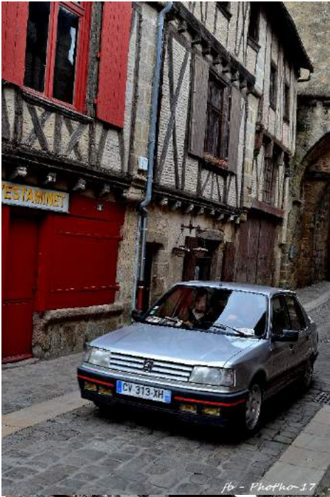
fb - Photo 17