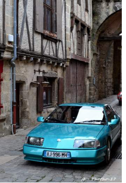
fb - Photo 17