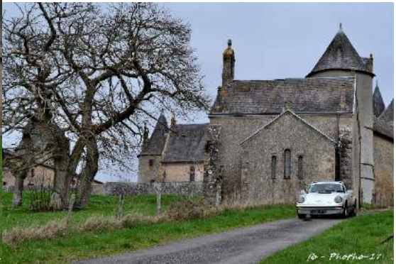
fr - Photo-17