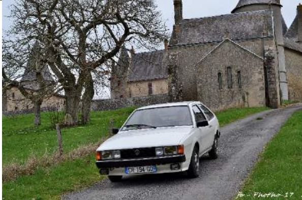
fr - Photo-17