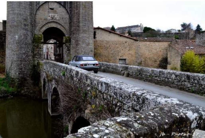
fb - Photo 17