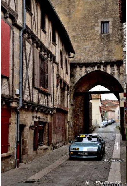
fb - Photo 17