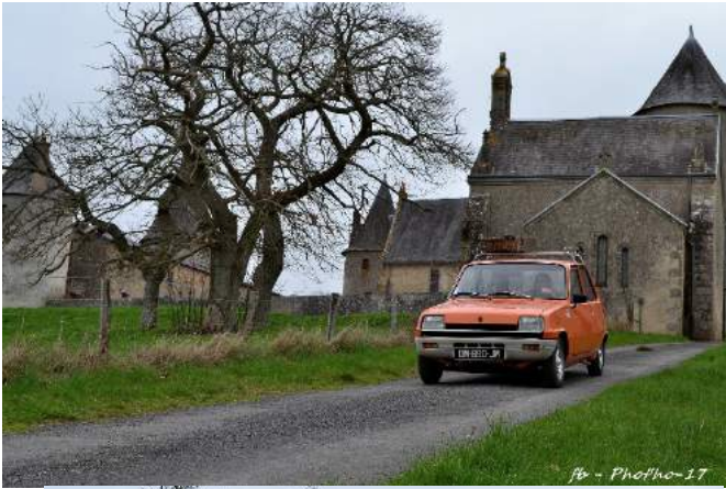
fr - Photo-17