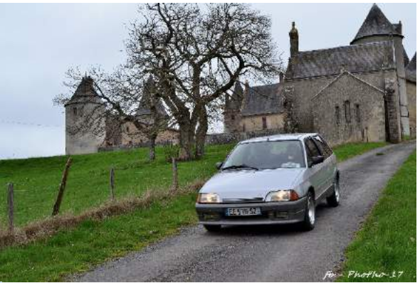
fr - Photo-17